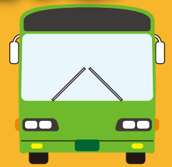
加越能バス (路線バス)